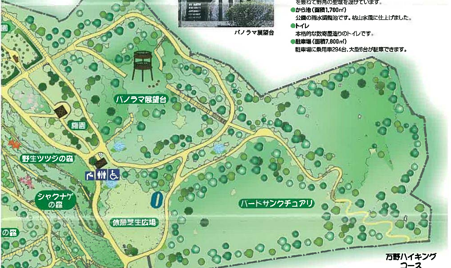
万野ハイキングコース