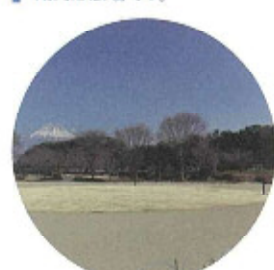
イベント広場 芝生を中央に配置したイベント用円形広場です。