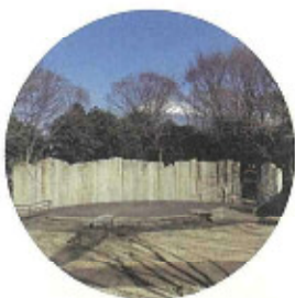
野外ステージ 市民の文化活動の一端として小コンサート・講演会等に利用できます。