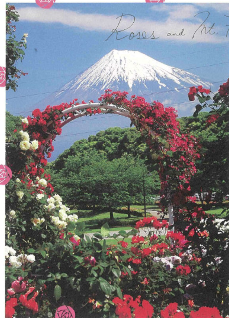
バラと富士山が見える公園

指定管理者:(公財)富士市振興公社 TEL 0545-55-3553/FAX 0545-57-0180 富士市役所 都市整備部みどりの課 TEL 0545-51-0123(代)/FAX 0545-53-2772