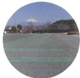
多目的広場 時には臨時駐車場としての機能を果たす広場です。