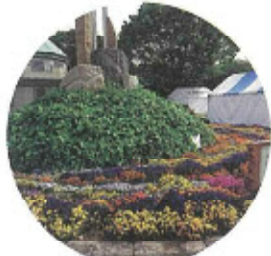
中央公園花壇 富士市花の会が管理しています。