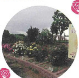
バラオーナー花壇 市民自らの手でバラを植え、育てています。