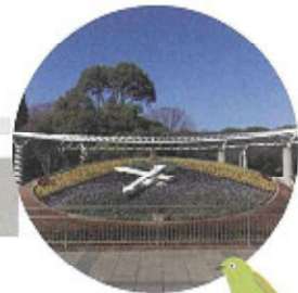
花時計 花時計は、四季折々の草花で満たされながら時を刻みます。