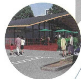
タリーズコーヒー 富士中央公園店 店内60席、テラス24席。