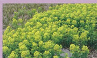
ノウルシ (3月中旬~4月中旬)