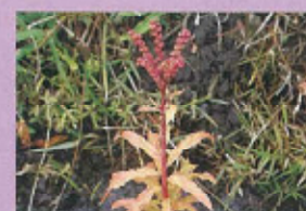
タコノアシ (9月中旬~11月中旬)