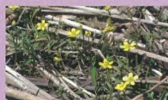
ヒキノカサ (3月中旬~4月中旬)