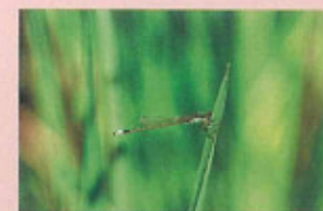
アオモンイトトンボ