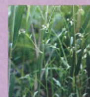
ナヨナヨスレナグサ (5月初旬~6月下旬)