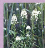
サワトラノオ (4月下旬~5月中旬)