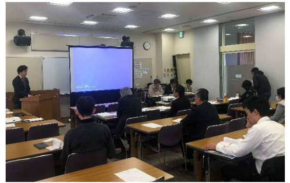
検討会の開催の様子