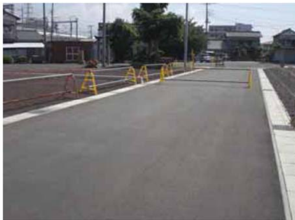
柳島浅間神社南側の区画道路（6-12 号線）

主な工事箇所として、関係権利者の皆様のご協力を得て、地区東南部では比較的広範囲で工事をさせて頂きました。また、柳島浅間神社南側の東西区画道路（6-12 号線）の一部工事が終了し、歩行者と自転車での通行が可能になり、地区西側から柳島浅間神社等へ向かう方にご利用いただいております。移転状況としましては、建物等の移転を 14 件進めさせて頂きました。