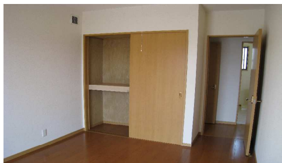
洋 室 1