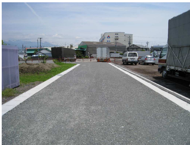
平成 19 年度 道路築造工事 6-27 号線 写真