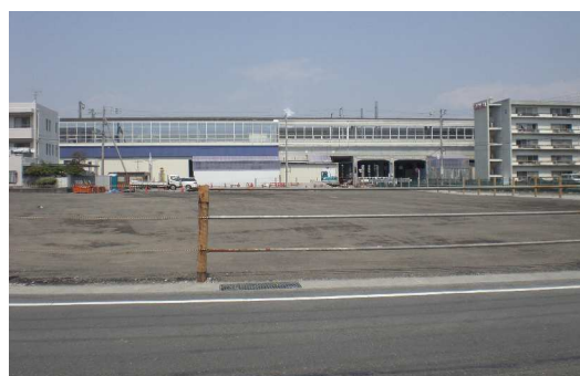
< 駅前の移転完了箇所 >