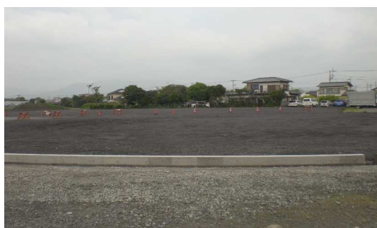
< 水田埋立箇所 >