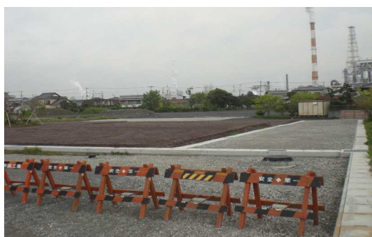
< 仮設住宅北側 宅地の整地箇所 >

これからも工事に際しましては、安全に十分配慮して進めてまいりますので、ご協力をお願いいたします。