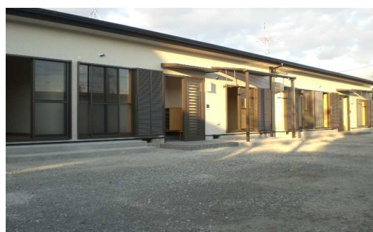
< 仮設住宅 >

平成 18 年 11 月 30 日に完成！ (地区東、2号公園予定地内) 事業により移転していただく期間、仮住まいをしなければならない権利者の方々のために昨年度 3 戸の仮設住宅を建設しました。 現在、既に入居されている方もおり、今後とも順次建設していく予定です。