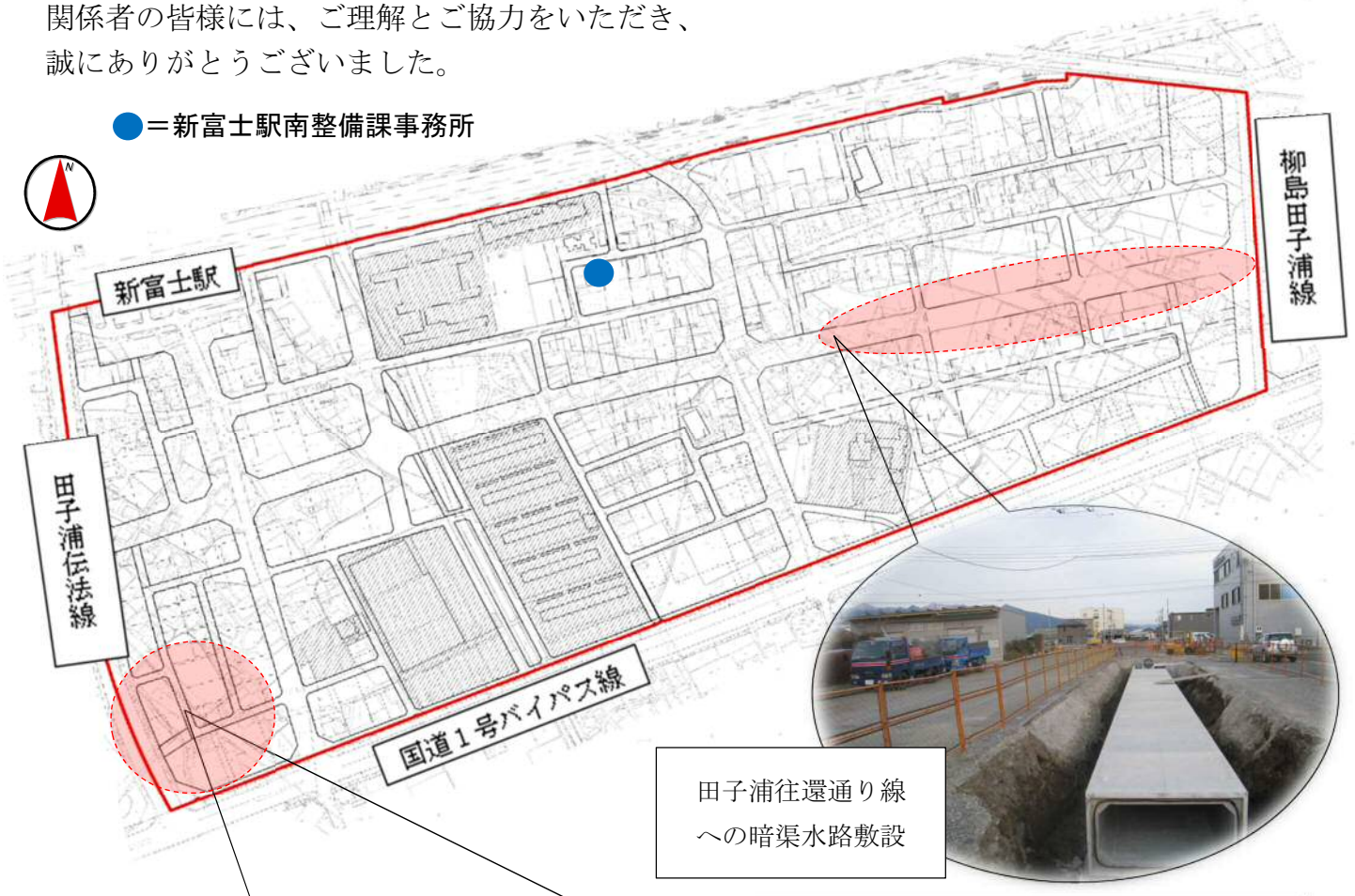
田子浦往還通り線 への暗渠水路敷設