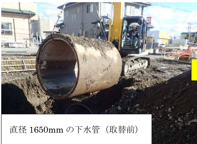
直径 1650mm の下水管 (取替前)