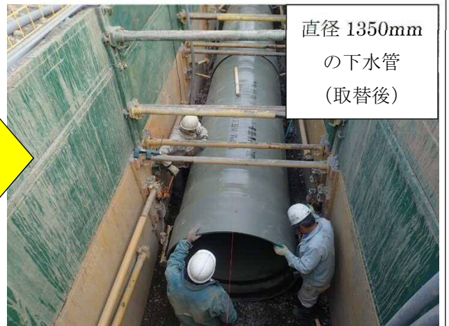
直径 1350mm の下水管 (取替後)