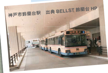
神戸市鈴蘭台駅