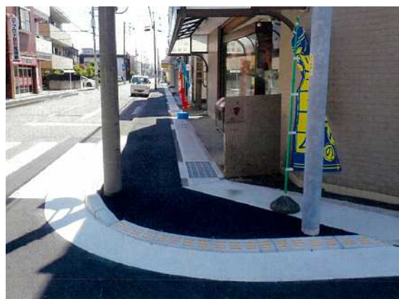
【完成写真②】矢印の方向から撮影