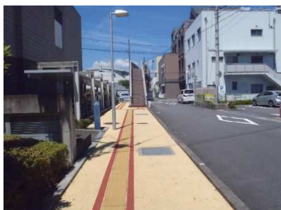
【完成写真①】矢印の方向から撮影