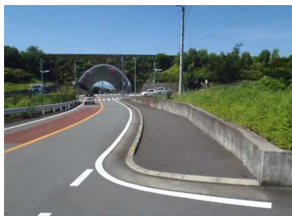
【完成写真②】矢印の方向から撮影