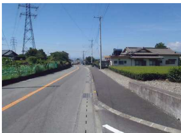
【完成写真①】矢印の方向から撮影