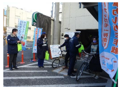
自転車乗車用ヘルメット着用促進キャンペーン