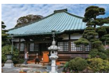
医王寺 Ioji Temple

市内東部の根方街道の北側にたたずむ古刹・医王寺。その参道の両脇にある湧水公園では、富士山の地下水が湧き水となって流れる。柳の並木や、湧水をたたえた池で鯉がのんびりと泳ぐ景色は、風情があふれる。