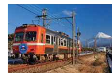
岳南電車 Gakunan Train

レトロな雰囲気と、富士山を背景に走る姿が人気のローカル線。鉄道本体としては初の「日本夜景遺産」である。月2回開催される「夜景電車」では、工場夜景が満喫でき、他にも年間を通じてさまざまなイベント列車が運行する。