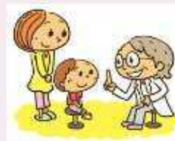
(イラスト：教育情報オンライン)

武漢市から帰国・入国される方におかれましては、咳や発熱等の症状がある場合や解熱剤などの薬剤を使用している場合には、検疫所で必ず申し出てください。また、国内で症状が現れた場合は、マスクを着用するなどし、あらかじめ保健機関に連絡の上様やかに受診機関を受診していただきますよう、御協力をお願いします。なお、受診に当たっては、武漢市の滞在歴があることを申告してください。