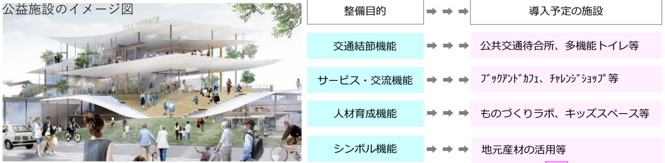
公益施設のイメージ図