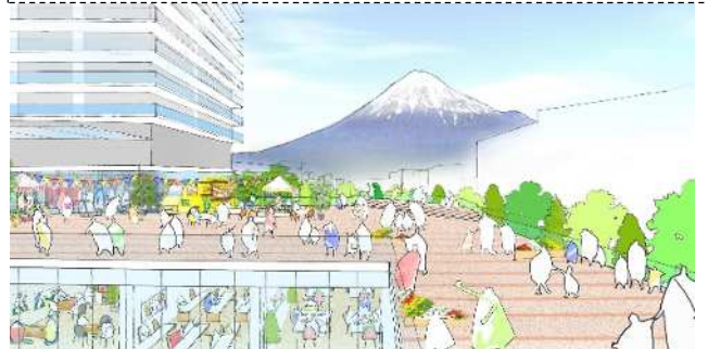
ペDESTリアンデッキからの富士山眺望

事業名：富士駅北口第一地区第一種市街地再開発事業 施行者：富士駅北口第一地区再開発組合 組合員：35名