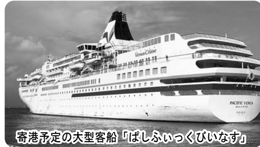
寄港予定の大型客船「ぱしふいっくびいなす」