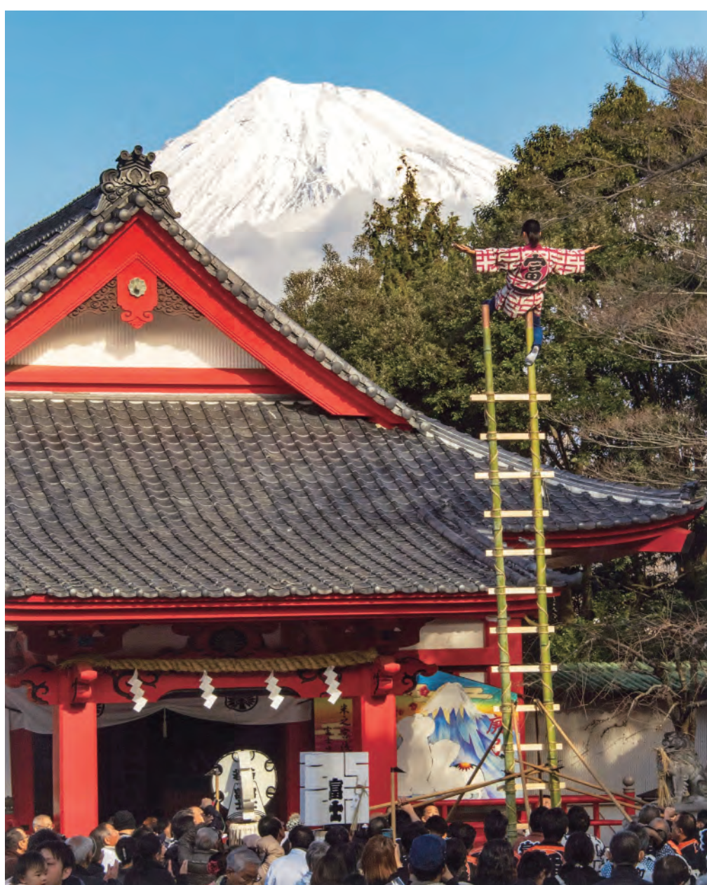
第15回富士山百景写真コンテストエリア賞「華麗・紅一点梯子のぼり」（エリア：米の宮公園）