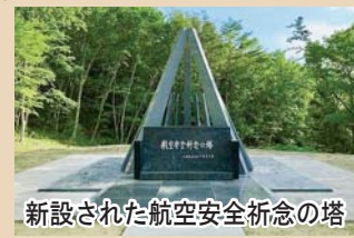
新設された航空安全祈念の塔

昭和46年7月30日、岩手県雫石町上空で発生した全日空機と自衛隊機との衝突事故により、富士市民125名を含む162名が犠牲となりました。