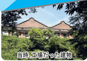
当時、工場だった建物