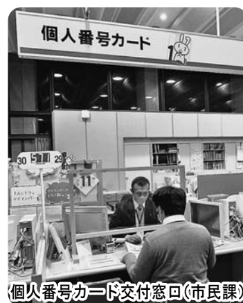
個人番号カード交付窓口(市民課)

要望 マイナポイント事業の効果もあり、今後も申請者の増加に伴う窓口の混雑が予想されるので、新型コロナウイルス感染症予防対策に十分留意しながら対応してください。