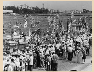
海上デモと大集会