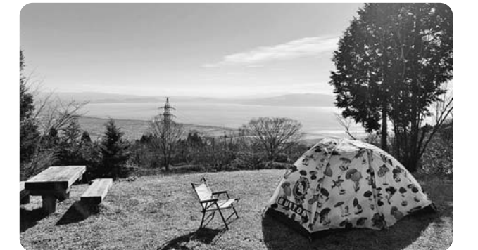
8月オープン予定の 野田山健康緑地公園(キャンプ場)

要望 野田山健康緑地公園は、観光振興の面でも有望な施設と考えるので、庁内関係課とともに、施設のPRや周辺施設との連携に努めてください。