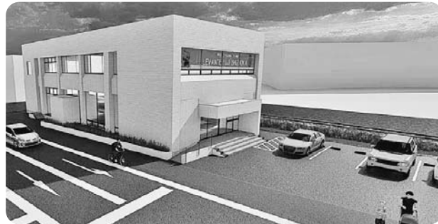
富士市サイクルステーション (完成予想図)

答 サイクルステーション内の6台程度の駐車場は、指定管理の対象としていますが、教育プラザの駐車場は、こちらが満車となった場合に使用することとしており、指定管理の対象外となります。