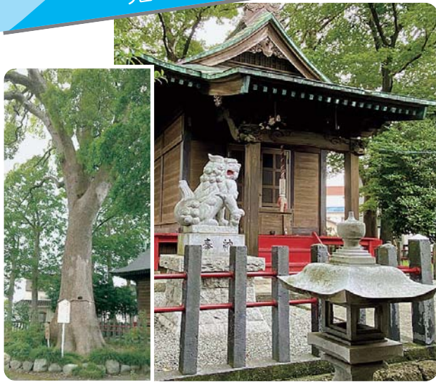
御神木のクスノキは 市指定天然記念物

御神木である大きなクスノキをはじめ、多くの木々に囲まれた「正一位 横割八幡宮」へぜひお参りください。