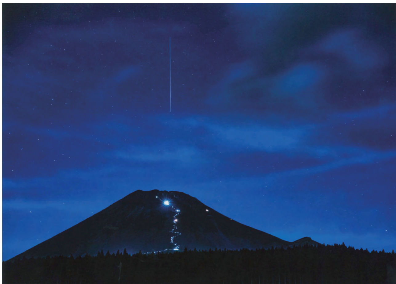
第15回富士山百景写真コンテストエリア賞作品 「ペルセウスからの便り」（エリア：林道富士山麓線）