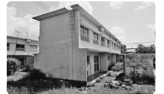
廃止となる新堀団地

答 富士市営住宅長寿命化計画に基づき、四、五階建ての耐火建築物の住宅等は当面、維持管理をしていきますが、建築後60年を経過し、耐用年数を過ぎている清水ヶ丘団地については新規の募集を停止しており、用途廃止をしていく予定です。