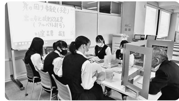
感染症対策をしながら意見交換

法案の論点整理に際し、議員から「義務だけでなく、その後の生活についても考えなければならない」、「野党に対抗するためにはSDGsの観点を取り入れることが必要」などの助言がありました。そのほか、生徒からは富士市の環境やまちづくりに対する要望も聞かれ、活発な意見交換が行われました。