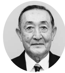
米山 享 範 第 47 代 議 長