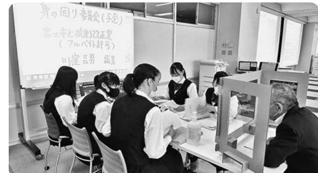
感染症対策をしながら意見交換

法案の論点整理に際し、議員から「義務だけでなく、その後の生活についても考えなければならない」、「野党に対抗するためにはSDGsの観点を取り入れることが必要」などの助言がありました。そのほか、生徒からは富士市の環境やまちづくりに対する要望も聞かれ、活発な意見交換が行われました。