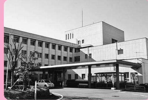
共立蒲原総合病院の外観

介護老人保健施設「芙蓉の丘」を併設し、訪問看護ステーションも運営しています。予防医学にも力を入れており、健診バス6台で地域の企業健診にも積極的に対応しています。