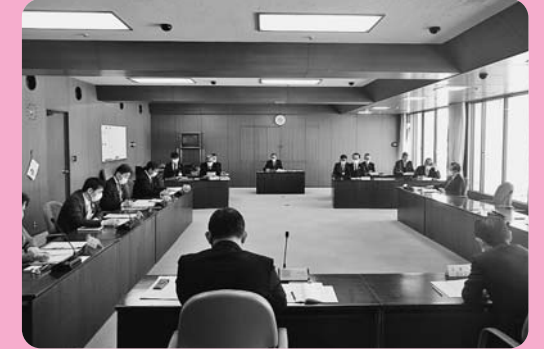
管理組合議会の様子

岳南地域は、戦後、紙・パルプ産業の著しい発展に伴い、工場からの大量の排水が河川を汚染し、環境悪化を招きました。昭和27年1月に静岡県が事業主体となり、工場排水専用の排水路の建設に着手し管理していました。その後、富士市、富士宮市の2市に移管されることとなった排水路施設を一体的に管理するため、昭和43年に岳南排水路管理組合を設立し、維持管理を行っています。