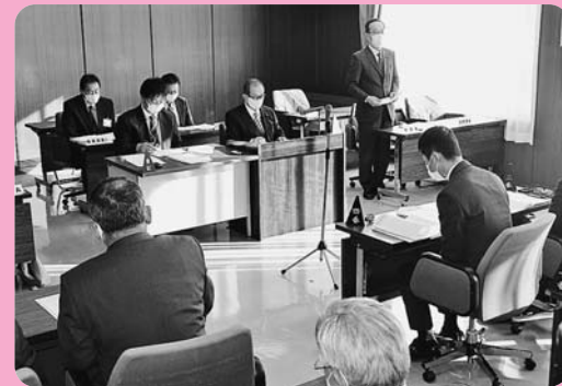
病院組合議会の様子

3市の市議会議員で構成する「病院組合議会」において、市民の健康保持に必要な医療が提供されるよう、経営上の重要事項や予算・決算等の審査を行っています。