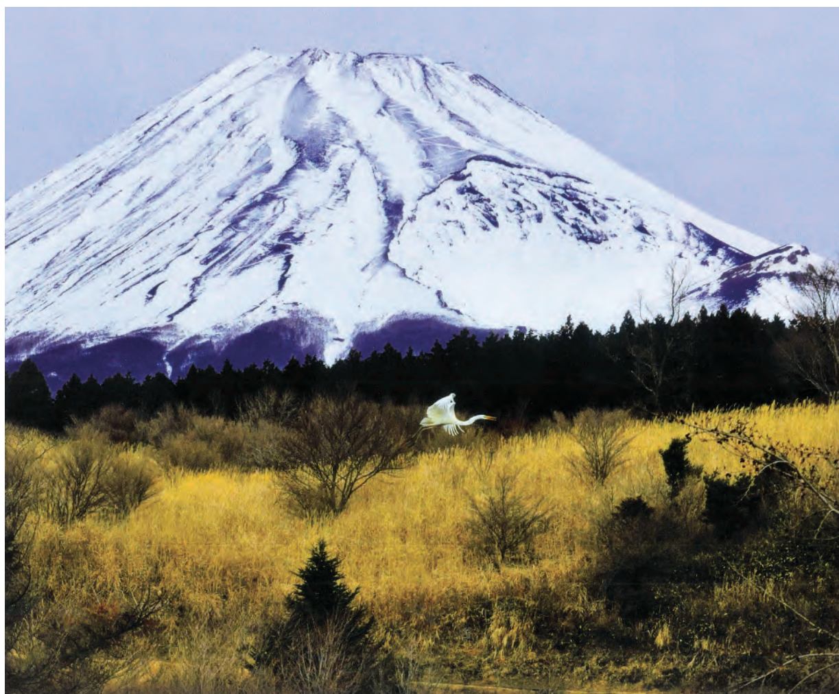
第16回富士山百景写真コンテスト銅賞作品 「富士に舞う」（エリア：富士山こどもの国）