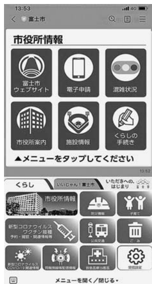
公式LINEの機能追加イメージ図▶

答 公式アカウントに約8万5000人の登録者がいることを生かし、現在の新型コロナウイルスワクチン接種情報だけでなく、防災関係や同報無線内容のほか、各課で行っている様々な市民サービスの内容を集約し、発信できる機能を追加したいと考えています。