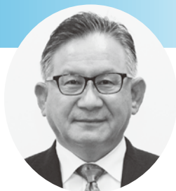
副議長 杉山 諭