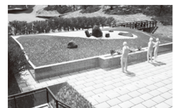
▲整備予定の合葬式墓地

答 本施設は、遺骨を骨壺から取り出し個別に袋へ入れ、納骨ピットに合祀するものです。民間の納骨堂とは異なり、個人の管理はしないため、一度埋蔵した遺骨は取り出すことができなくなりますが、安価に永代管理ができる合葬式墓地を整備するものです。