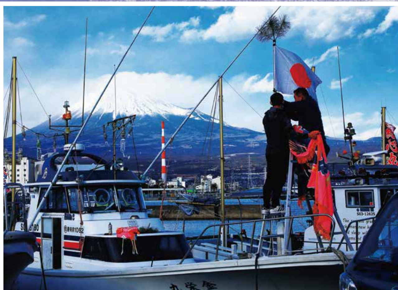
第17回 富士山百景写真コンテスト 観光写真部門入選作品 「明日に向けて!」(エリア:田子の浦港西)