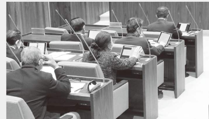
▲本会議でタブレット端末を操作する議員

タブレット端末を活用し、ペーパーレス会議を行っています。また、ZOOM(ビデオ会議アプリ)を試行導入し、議員は直接、会議室に来なくても会議を傍聴できるようになりました。さらに、議会での連絡体制の強化として、昨年9月1日の富士市総合防災訓練において、タブレット端末から安否確認連絡を行いました。