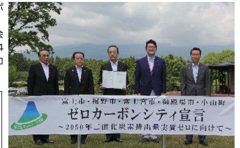
宣言の様子(御殿場市遊RUN/パーク玉穂)