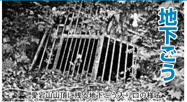
愛宕山山頂に残る地下ごう入り口の様子