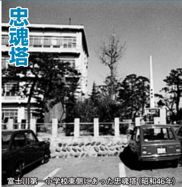
富士川第一小学校東側にあった忠魂塔(昭和46年)