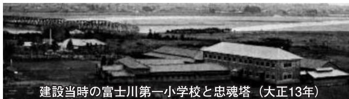
建設当時の富士川第一小学校と忠魂塔(大正13年)