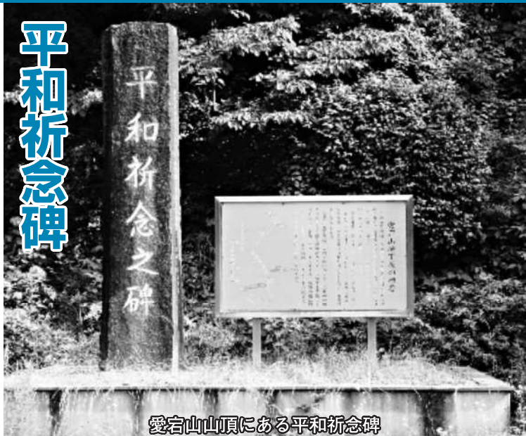
愛宕山山頂にある平和祈念碑