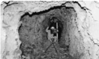
地下ごう測量調査時の写真