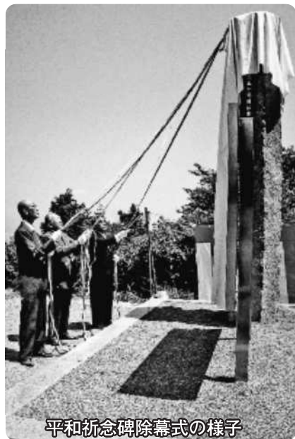
平和祈念碑除幕式の様子

場所は、戦時中につくられた愛宕山山頂の最も大きい地下ごうの入り口近くに建立しました。高さ3メートルにも及び松野地区産の俵石と呼ばれる石材と、愛宕山山頂の地下ごうの概要を記載したステンレス製の説明板が設置されています。