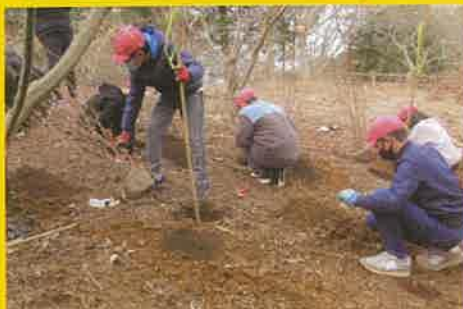
みどりのふれあい事業(三島市)植樹活動を支援