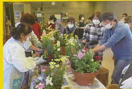
寄せ植え教室(富士宮市)の開催を支援