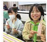
緑の少年団交流集会 my着づくり