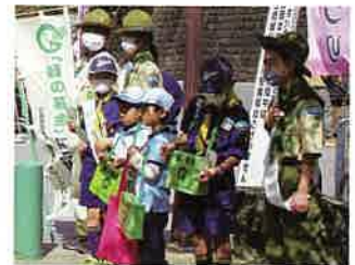
ボーイスカウトによる緑の募金活動