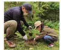
親子で県民参加の森づくり参加植樹活動