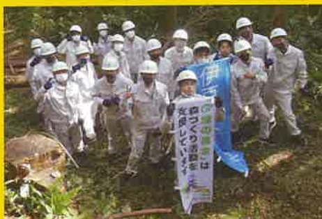
静岡県立伊豆総合学校 学校林での森林整備を支援